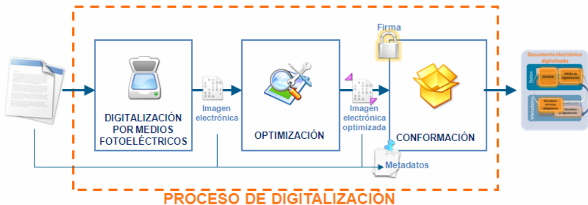
Figura 2. Tareas en el proceso de digitalización.