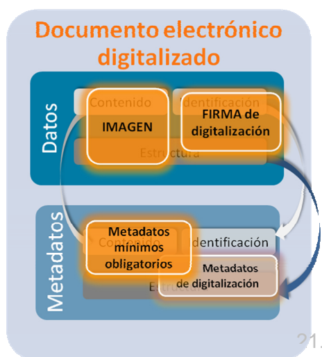
Figura 1. Documento electrónico resultado de digitalización.