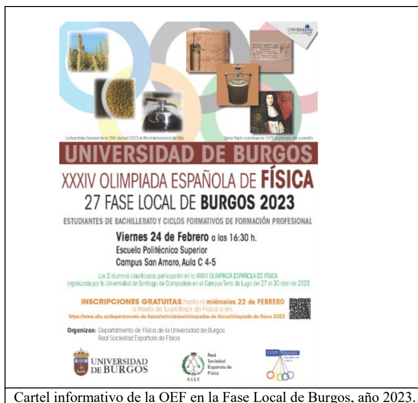
Cartel informativo de la OEF en la Fase Local de Burgos, año 2023.

La FAO invita a participar en el IYMIJO2023 ( https://www.fao.org/millets-2023/join-us/es ). Ello ha motivado la temática identificadora del anuncio de nuestra actividad OEF, como se representa en la figura siguiente, donde se visualiza la imagen del cartel de la Fase Local en Burgos.