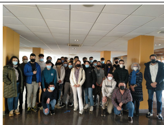
Alumnos y algunos profesores en la fase local de Burgos, realizada en marzo de 2022.

Posteriormente se realiza la Fase Nacional que consiste en el proceso de selección de los estudiantes que forman los equipos participantes en las olimpiadas internacionales. El pasado año esta fase, debido a la crisis sanitaria provocada por el coronavirus, por tercer año dejó de realizarse presencialmente y acabó celebrándose de forma telemática en la mañana del viernes 29 de abril, siendo 97 el número de estudiantes participantes. Durante el tiempo que duró la prueba de esta competición, los participantes se enfrentaron a dos problemas teóricos que versaron sobre el campo eléctrico existente en la atmósfera y sobre el nuevo telescopio Web lanzado al espacio en la Navidad 2021/22. Debieron resolver también un tercer problema de un supuesto experimental sobre el