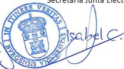
Isabel Castrillo Ojeda