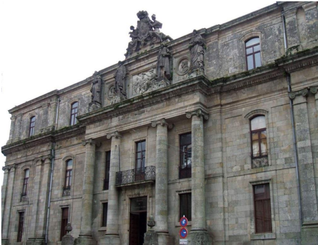
PLAZA DE LA UNIVERSIDAD, SANTIAGO DE COMPOSTELA