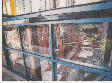
Huero de una escalera.

De hecho, en los peores momentos del sector la Escuela decidió empezar a construir una edificación real, bautizada como 'edificación docente', en sus laboratorios ante la escasa demanda de las empresas. De igual forma, el centro se adaptará completamente en septiembre a la llamada metodología BIM de modelado de información para construcciones, un nuevo enfoque que permite hacer un seguimiento de estas desde el proyecto hasta su mantenimiento.