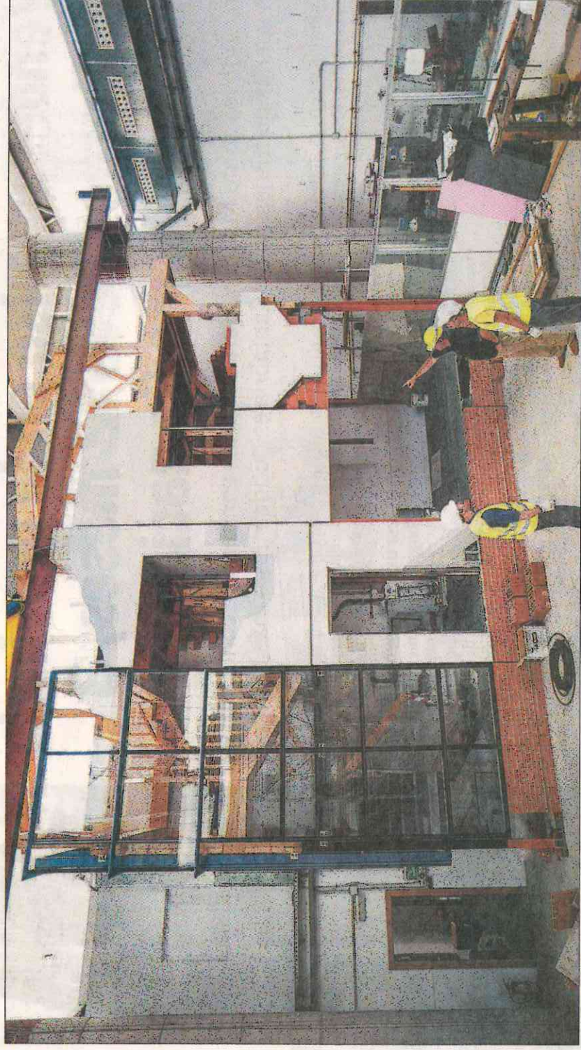
Hace dos años y debido al escaso número de convenios el centro decidió construir un edificio real en sus instalaciones de la Milanera.

La programación cultural de la UBU para este verano contará con la presencia de la periodista Rosa María Calaf, que pronunciará la conferencia inaugural el día 13. Se desarrollará en el Fórum bajo el título El reto de contar la verdad en el siglo XXI .