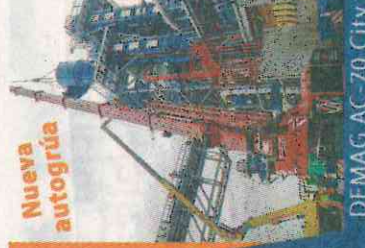
DEMAG AC-70 City