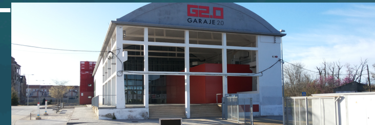
Crowdfunding Garaje 2.0 Extremadura Open Future, Cáceres