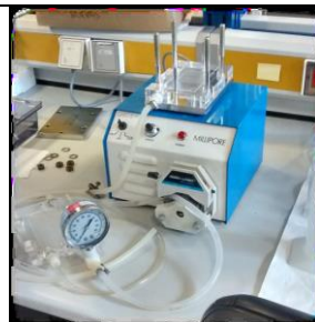
MODULO DE ULTRAFILTRACION CON MEMBRANAS PLANAS