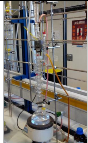
TORRES DE RECTIFICACION