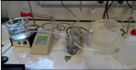
BALANCE DE MATERIA EN ESTADO NO ESTACIONARIO