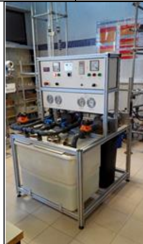
EVAPORADOR DE PELÍCULA ASCENDENTE