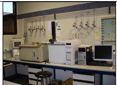
ANALISIS CROMATOGRÁFICO BIOCOMBUSTIBLES