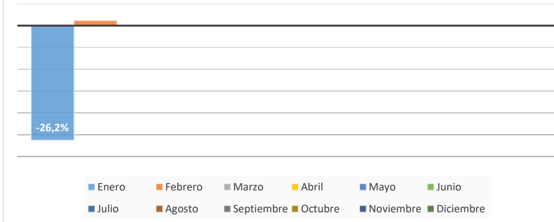
CONSUMO GAS NATURAL kWh MENSUAL - 2024 Comparativa % respecto al consumo en 2023