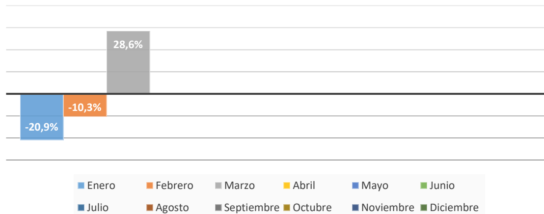
CONSUMO GAS NATURAL kWh MENSUAL - 2024 Comparativa % respecto al consumo en 2023