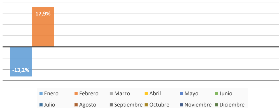
CONSUMO GAS NATURAL kWh MENSUAL - 2024 Comparativa % respecto al consumo en 2023