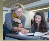
TABLA 4. Tutorías